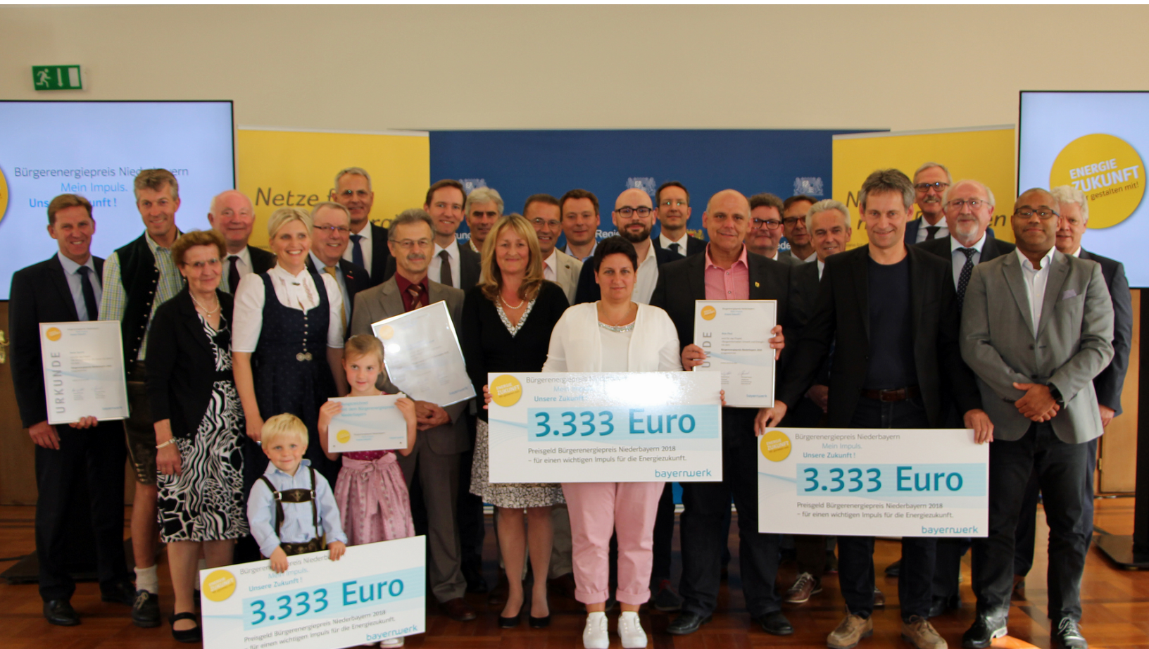
Verleihung des Bürgerenergiepreises Niederbayern 2018: Die Preisträger kommen aus Viechtach (Lk Regen), Simbach (Lk Dingolfing-Landau) und Essenbach (Lk Landshut).